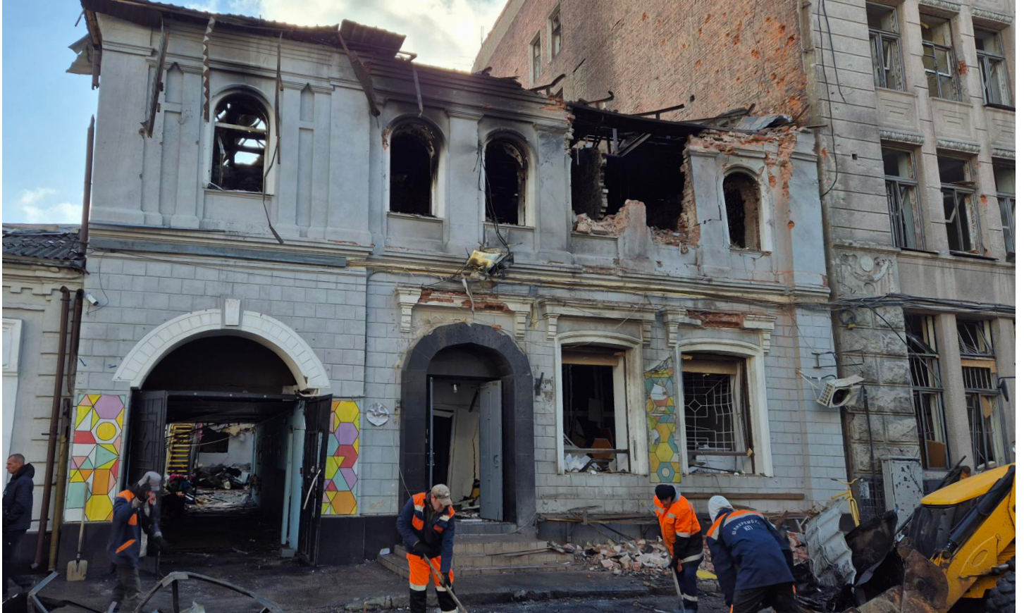
Частный детский сад, пострадавший в результате атаки барражирующими боеприпасами в Харькове 22 октября 2025 года.